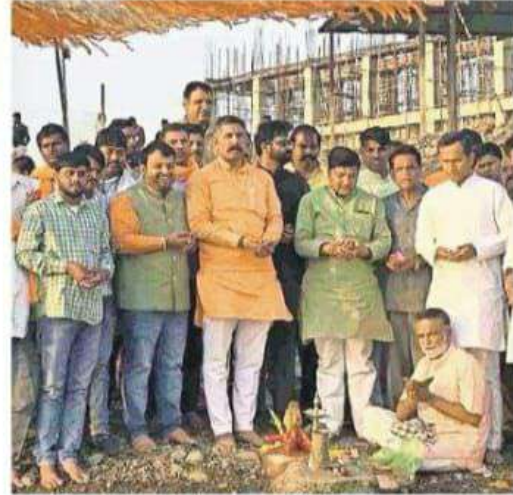
भाजपा और कांग्रेस दोनों दलों के नेता नर्मदा महोत्सव में शामिल हुए ।