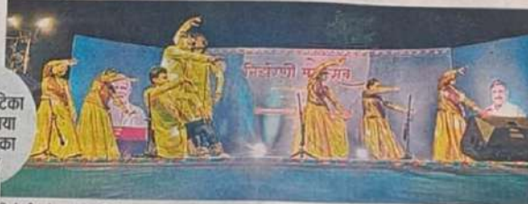
नृत्य नाटिका से बताया नदियों का महत्व

निर्गुण भक्ति की धारा बहाई। जीवन-मरण को खोल ग्वाया मनवा। धारी उमर घली है जैसे रेल मनसा। नर्मदा जल में कंकर शंकर है जैसे भक्ति गीतों के साथ चचाई गीत, मंगल गीत भी प्रस्तुत किए गए। राज्य शासन के संस्कृति विभाग, जिला प्रशासन तथा जबलपुर पुरातात्विक, संस्कृति एवं पर्यटन परिषद के तत्वावधान में आयोजित निर्गुणी महोत्सव में स्थानीय यादव के दल ने नदियों के महात्व पर आधारित नृत्य नाटिका प्रकाशनी की प्रस्तुति दी।