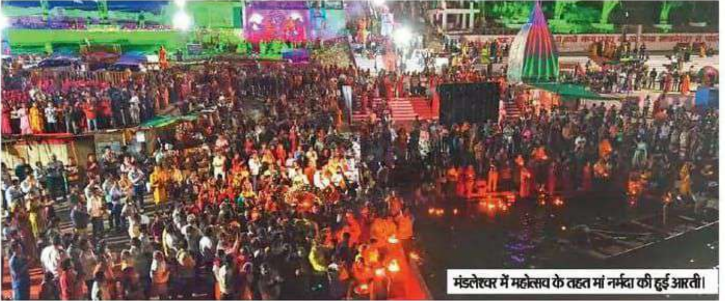
मंडलेखर में महोत्सव के तहत मां नर्मदा की हुई आरती।