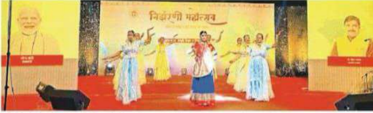
इंदौर में निर्झरणी महोत्सव में नृत्य की प्रस्तुति देते कलाकार ।

सादाशिव नाट्य कला समिति भोपाल की जीवनदायिनी मां नर्मदा पर नृत्य नाटिका की प्रस्तुति काफी सराहनी गई। इसमें मां नर्मदा की महिमा का मनमोहक चित्रण जन मंच पर कलाकारों ने किया तो दर्शक नर्मदा के प्रति कृतज्ञता और धन्यता के भाव में हूब गए। स्थानीय पुलिस गार्डेट पर