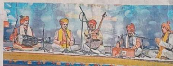
कार्यक्रम के दौरान लोक गीतों की प्रस्तुति देते लोक गायक। ● नईदुनिया

औकरेश्वर, खंडवा सहित प्रदेश के 14 जिलों में किया गया। सभी स्थानों पर सांस्कृतिक कार्यक्रम हुए। परिजनो संग किए मां नर्मदा के दर्शनक रीतजाज ने कहा कि मां नर्मदा के प्रकटवोसव पर पूरे शहर में धूम रही। हर कोई मां की आराधना करते नजर आया। सुबह से रातों में मां नर्मदाघाट के शायें ने भक्तिमय माहौल बनाया। तीन-चार परिषद